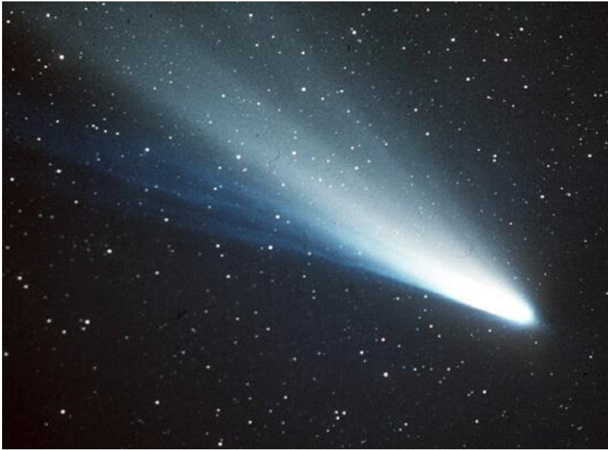
Foto 2: De Halley komeet op 09.03.1976 met een blauwe staart en een witte sliert stof. De komeet werd naar de Engelse natuurkundige Edmond Halley (1656-1742) genoemd, die zich verdienstelijk heeft gemaakt met de baanbepaling.

Maar kometen komen niet in aanmerking als ster van Bethlehem door meerdere redenen: