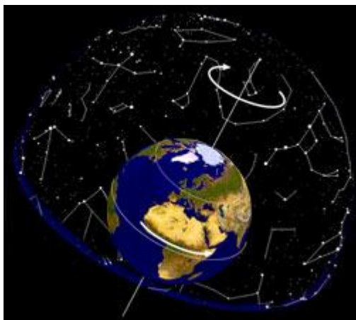
Foto 6: De aarde draait in 24 uur zich één keer om haar poolas. Haar draairichting is van west naar oost gericht. Omdat het firmament vaststaat, hebben wij als observeerders op de aarde de (schijnbare!) indruk, als zou het firmament van oost naar west draaien. Anders uitgedrukt: Alle hemellichamen gaan in het oosten op en in het westen onder.

En nu komen we bij de belangrijkste reden, waarom kometen, supernovae en planetaire combinaties en alle soorten principieel niet de ster van Bethlehem kunnen zijn: Al het gesternte (zon, maan, planeten, kometen, Novae) gaan in het oosten op en gaan in het westen onder! De draaibeweging van de aarde in 24 uur om de eigen as laat het hele firmament in voortdurende schijnbare beweging verschijnen (foto 6). Geen astronomisch gesternte zou als wegwijzer voor de wijzen uit het oosten geschikt zijn om hen meerdere weken lang dag in dag uit in westelijke richting te leiden, daarna onzichtbaar te worden en later boven een speciaal huis te schijnen (zie hoofdstuk 4).