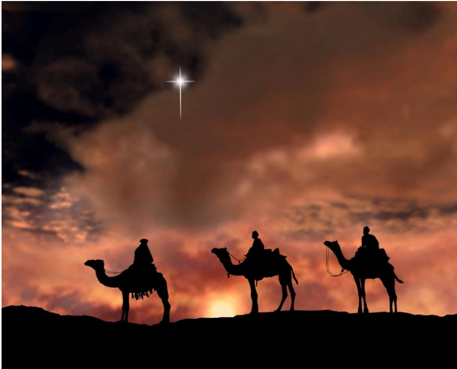
Foto 1: Realistische voorstelling, hoe fel schijnend de ster van Bethlehem zeker geweest zal zijn. Voor wat betreft het aantal van de wijzen uit het oosten, zie hoofdstuk 7.

Afbeelding van de „fulldome show“ (een heel modern projectiesysteem): „Mystery of the Christmas Star“, („Mysterie van de ster van Kerstmis“), geproceerd door Evans & Sutherland