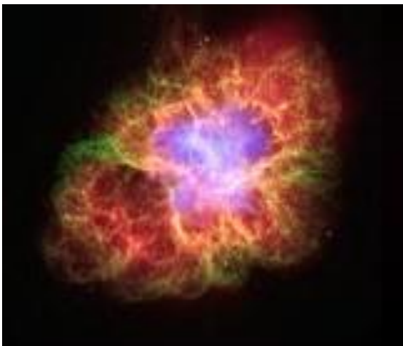
Foto 3: De Kreeftnevel – een overblijfsel van de Supernova uit het jaar 1054. In die tijd was het de helderste ster aan de hemel. Hij was drie weken lang waarneembaar – ook overdag. Een Chinese hofastronoom heeft deze lichtverschijning beschreven.

Aanwijzing: In het boek van Werner Papke „Das Zeichen des Messias“ („Het teken van de Messias“) op bladzijde 81-89, wordt de zienswijze gehuldigd dat de ster van Bethlehem een Supernova geweest moet zijn. Maar dit wordt slechts aangenomen. Het gaat hier dus niet om een waargenomen Nova.