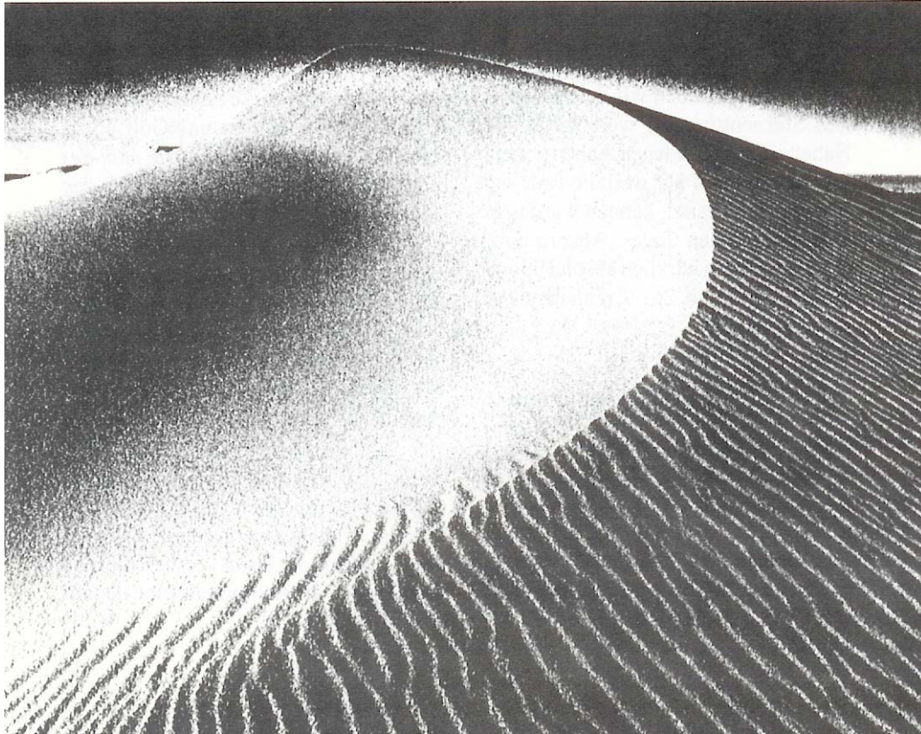
Wanderdüne auf der Kurischen Nehrung, einer 100 Kilometer langen und zwischen 380 Meter und 4 Kilometer breiten Landzunge zwischen der Ostsee und dem Kurischen Haff.