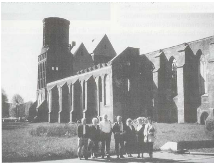
Unsere Reisegruppe vor der Ruine des Königsberger Doms (Mai 1994). Erbaut wurde der Dom im 14. Jahrhundert; zerstört im Zweiten Weltkrieg.

In den nächsten Tagen waren einige Vorträge an der Universität Königsberg (heute: Kaliningrad) angesetzt. Nach einem Vortrag am Mathematischen Institut stand ein Professor in der Diskussion auf und sagte: „Wissen Sie, Sie haben uns viel fachlich Interessantes gesagt, aber was Sie über Gott gesagt haben, das hat uns noch viel stärker beeindruckt.“ Ich weiß nicht, ob wir uns eine solche Situation an einer deutschen Hochschule vorstellen können, wo ein Professor vor versammelter Mannschaft - vor Studenten und Assistenten - aufsteht und so deutlich sein Interesse an Glaubensfragen bekundet. Ähnliche Begebenheiten erlebten wir immer wieder.